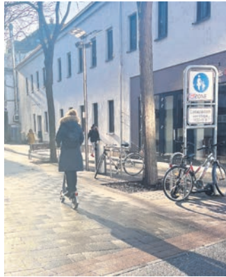
Auch weiterhin sollen E-Scooter sowie deren Fahrerinnen und Fahrer verstärkt kontrolliert werden

Am Donnerstag versuchte eine Person, welche mit einem nicht versicherten Fahrzeug gefahren ist, zunächst, sich einer Kontrolle zu entziehen, konnte jedoch unmittelbar aufgehalten werden. Im Verlauf der Verkehrskontrolle wurden Anzeichen für eine Betäubungsmittelbeeinflussung festgestellt, weshalb die Entnahme einer Blutprobe angeordnet wurde. Da für den mitgeführten E-Scooter zudem kein Eigentumsnachweis vorgelegt werden konnte, wurde dieser zudem im Anschluss sichergestellt. Neben einer Strafan-