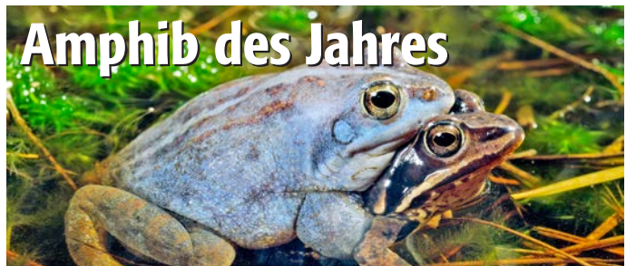
Der Moorfrosch ( Rana arvalis ) ist der „Blaumann“ unter den Fröschen – zumindest zur Balzzeit im Frühjahr. Die Deutsche Gesellschaft für Herpetologie und Terrarienkunde ( www.dght.de ) hat ihn zum Amphib des Jahres gekürt.

Am Abend kam es zudem zwischen Bechtheim und Osthofen auf der K 42 zu einem Hangrutsch bei welchem ebenfalls Verkehrsmaßnahmen durch die Polizei Worms getroffen werden mussten.