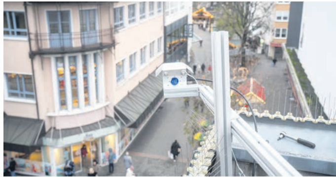
Eines der Messgeräte, welche gegen Ende 2023 über „Worms wird WOW!“ in der Fußgängerzone installiert worden sind.

Anhand der von „Worms wird WOW!“ übermittelten Daten lassen sich folgende Mittelwerte berechnen: Während im Betrachtungszeitraum 1. Dezember 2023 bis 1. Dezember 2024 durchschnittlich pro Tag 4.063 Passanten das Messgerät in der Kämmererstraße Süd (Ausgang Marktplatz) und 14.549 Personen das Pendant in der Wilhelm-Leuschner-Straße (KW) passierten, nahm die Passantenfrequenz zum Weihnachtsmarkt marginal auf durchschnittlich 4.100 respektive in der KW 16.380 Passanten pro Tag (plus ca. 13 Prozent) zu.