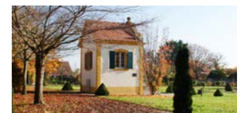
Der Barockgarten in Freinsheim.

Die B-Gruppe fährt mit der Bahn um 10.16 Uhr von Worms nach Frankenthal. Von dort geht es der Lambsheimer Straße entlang in westlicher Richtung. Die Gruppe überquert die A61 und folgt der L522 am Lambsheimer Friedhof vorbei nach Weisenheim am Sand. Man durchquert und streift das Naherholungsgebiet Ludwigshain, wo das Tagesziel Freinsheim zu sehen ist. Über die Weisenheimer Straße und Herrenstraße erreicht die Gruppe gegen 13.30 Uhr das Abschlusslokal.