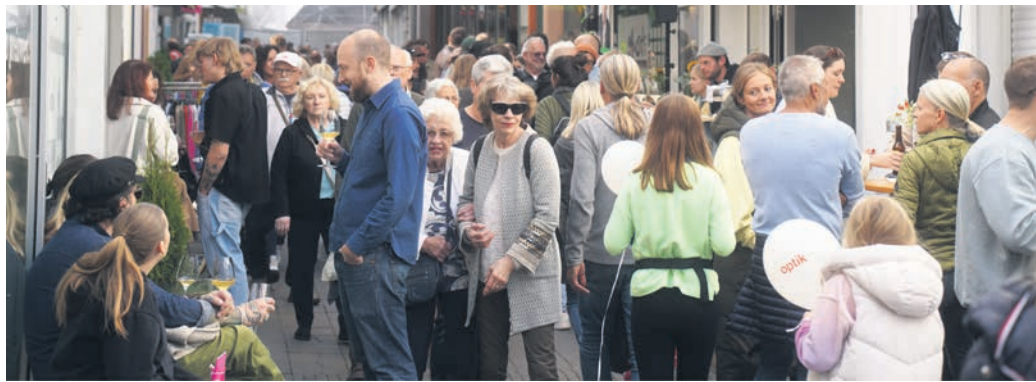
Die Hafergasse an einem Aktionstag.