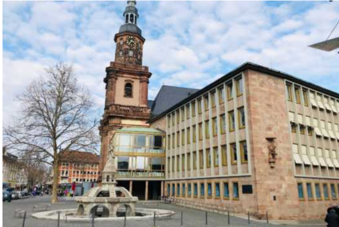
Vom 26. Januar bis zum 14. Februar muss die Stadtbibliothek im Haus zur Münze geschlossen bleiben

Aufgrund der Umstellung ergeben sich in der Schließzeit auch einige Einschränkungen für die Nutzer: Das eigene Bibliothekskonto kann nur noch eingesehen werden, Verlängerungen, Vormerkungen sowie