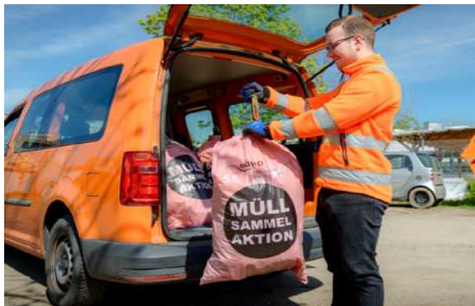
Jedes Kilogramm Müll wird gewogen und hilft gemeinnützigen Wormser Organisationen.

Von Anfang Februar bis Ende März 2026 sucht die Entsorgungs- und Baubetrieb Worms AöR (ebwo AöR) engagierte Helferinnen und Helfer, die das Wormser Stadtgebiet von Müll bei der Aktion „Let's Clean Up Europe“ befreien. Ob in der Innenstadt oder den Vororten, auf Feld- und Waldwegen oder am Rheinufer – leider findet sich „wilder Müll“ fast überall. Deshalb heißt es: Europa räumt auf – und Worms ist dabei.