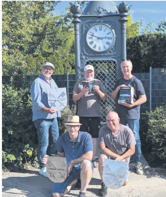
Aus der Sparkassen-Standuhr ist im August 2024 ein Bücherschrank geworden – nur ein Projekt von vielen auf dem angedachten Mehrgenerationenplatz.

Weitere Vorhaben, darunter die geplante Gestaltung eines Mehrgenerationenplatzes, sollen nun unter dem Dach des Vereines weitergeführt werden. Dieser Platz soll allen Bürgerinnen und Bürgern offenstehen.