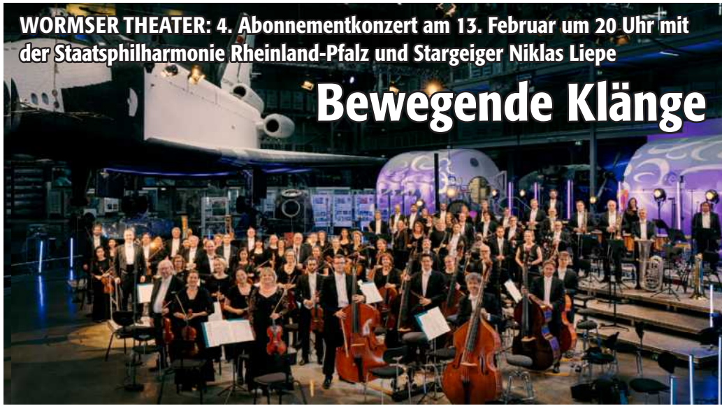
WORMSER THEATER: 4. Abonnementkonzert am 13. Februar um 20 Uhr mit der Staatsphilharmonie Rheinland-Pfalz und Stargeiger Niklas Liepe