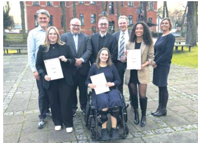
Die Preisträgerinnen zeigen mit ihren großartigen Abschlussarbeiten eindrucksvoll, dass Nachhaltigkeits- und Risikothemen im Fokus sind und innovative Ansätze herausfordern.