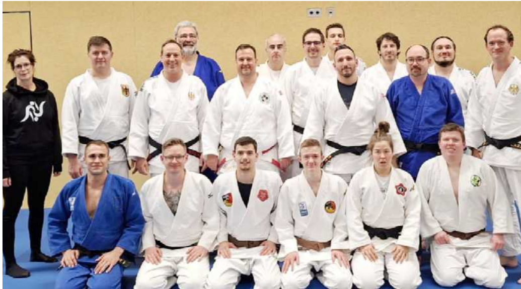
Die Teilnehmer des Lehrgangs des Deutschen Judo-Bundes (DJB) im hessischen Maintal.

In der ersten Einheit stand die gemeinsame Regelanpassung und -ergänzung im Fokus, die im engen Austausch zwischen Kampfrichtern und Trainern erarbeitet wurde.