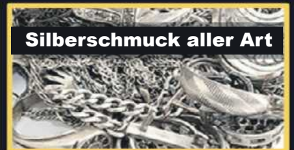
Silberschmuck aller Art