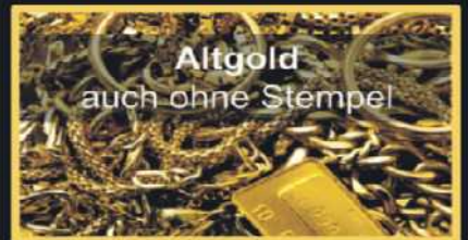
Altgold auch ohne Stempel