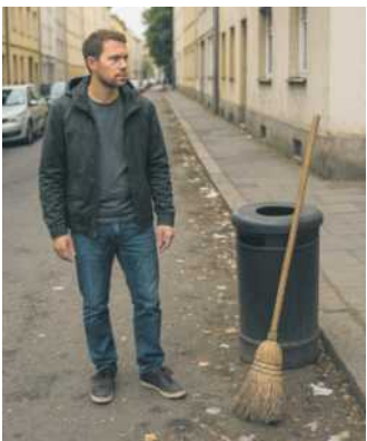
Gereinigt werden muss mindestens alle zwei Wochen.

Zu den Aufgaben der Entsorgungs- und Baubetriebs AÖR der Stadt Worms (ebwo AÖR) gehört laut Satzung auch die Straßenreinigung im innerstädtischen Bereich sowie in den Stadtteilen