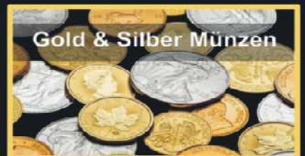
Gold & Silber Münzen