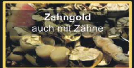
Zahngold auch mit Zähne

WIR KAUFEN IHR ALTGOLD, SCHMUCK, BRUCHGOLD, ZAHNGOLD, MÜNZEN, SILBER, MODESCHMUCK, SILBERBESTECK, ZINN